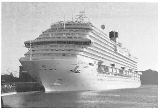
佐世保港に入港したコスタクルーズの新造クルーズ客船「コスタ・ベネツィア」

お隣の中国のクルーズマーケットでは、上海や天津発着の北部マーケットがやや弱含みなものに対して、南部マーケットは急成長をとげており、厦門、香港、南沙、海南発着のクルーズがたくさん出るようになっている。CLIAの統計によると、2018年のクルーズ客船寄港回数は、上海が416回、天津が110回だが、南部の香港が249回、南沙が104回、厦門が99回、深圳が78回となっている。しかも香港以外は発着クルーズが中心となっており、それぞれの地元マーケットが着実に成長していることを示している。また各クルーズ会社は南部発着クルーズのための新たな寄港地として、沖縄諸島に次ぐ港を開発しつつあり、フィリピン、ベトナム、インドネシアの港への寄港を開始している。