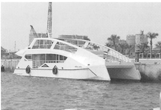
太陽電池で発電した電力をバッテリーに溜める石垣島の観光船「vibes one」

さて、日本では完全バッテリー船はまだ小型船に限られており、造船企業ではツネイシクラフト&ファシリティーがそのトップランナーといえる。同社が建造した大阪の河川・運河クルーズのバッテリー観光船「あまのかわ」はシップ・オブ・ザ・イヤーを2012年に受賞した。さらに同社が建造した石垣島の観光船「vibes one」はフェリーターミナルの屋上に設置した太陽パネルで充電して再生可能エネルギーを利用する実証実験もしているという。大島造船が建造したバッテリーフェリー「e-Oshima」は、自動運航技術開発の実証実験船としての役割も担っている。今後の、日本でのバッテリー船の普及は、再生可能エネルギーとのリンクをいかに結べるかにかかっている。