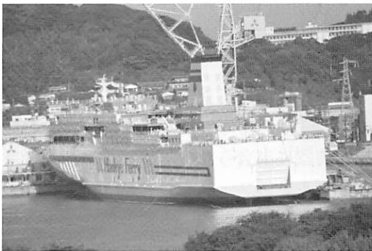
三菱造船下関造船所で建造が進む阪九フェリーの神戸~新門司航路の「せつつ」

そして日本にもついにLNG燃料のフェリーが登場するというから俄然期待は高まる。「バイキング・グレース」(58,000総トン)を視察した時には、燃料コスト自体はLNGにしてもあまり変わっていないと聞いたが、日本ではどうなのであろうか。日本政府の発表によると、石油による火力発電がkWhあたりのコストが29~42円なのに対して、LNG火力発電は13.4円とほぼ半分以下という。船舶燃料の場合も、いずれ同様に燃料コスト的にもLNG燃料船の方が有利になる時代になるようにも思う。